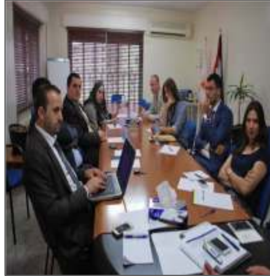
إيجاد آلية قانونية للاستعلام عن العملاء وشيكااتهم المقدمة للتحويل