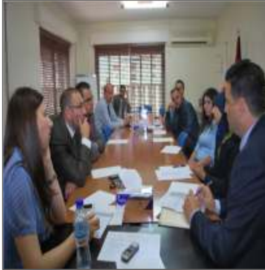
تحديد نوعية البيانات والتقارير المالية الواجب إعدادها من قبل المنشآت