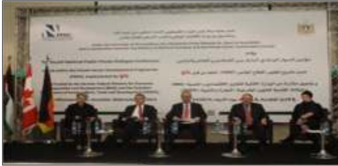
مؤتمر الحوار الاقتصادي الرابع