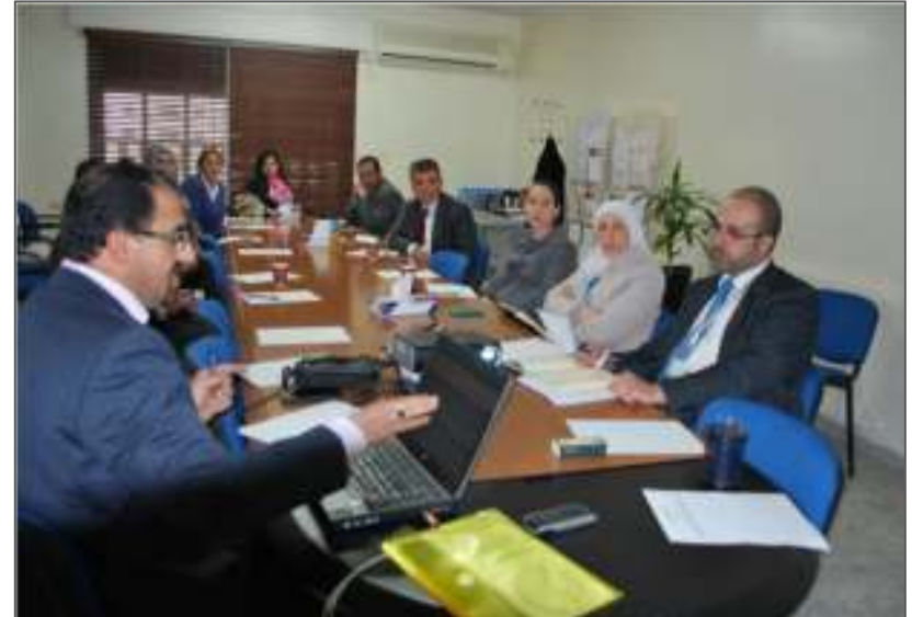
لقاء حول برنامج الشهادات المهنية للقطاع المالي