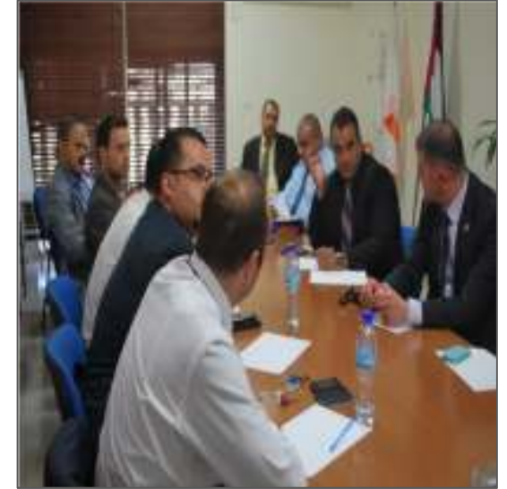
وضع قائمة بالبيانات التي تحتاجها البنوك من سجل الشركات لدى وزارة الاقتصاد