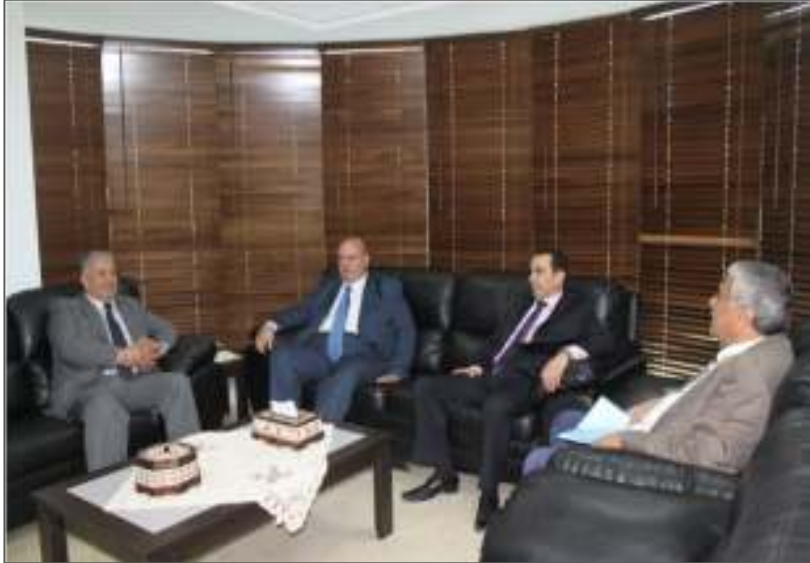
لقاء مع رئيس مجلس القضاء الأعلى