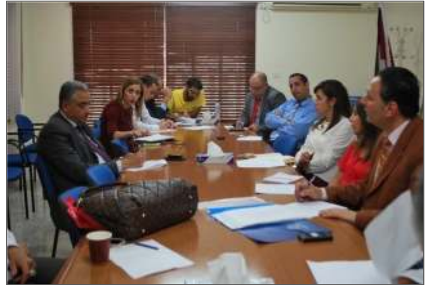
الاجتماع التحضيري الخاص بإطلاق الحملة الإعلامية للمؤسسة الفلسطينية لضمان الودائع