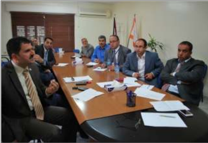
الاجتماع التحضيري لإطلاق حملة توعية الجمهور بالفوائد المصرفية