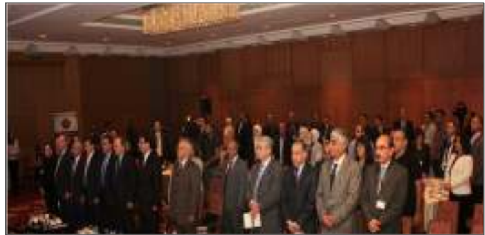
المؤتمر الثاني لإدارة المخاطر