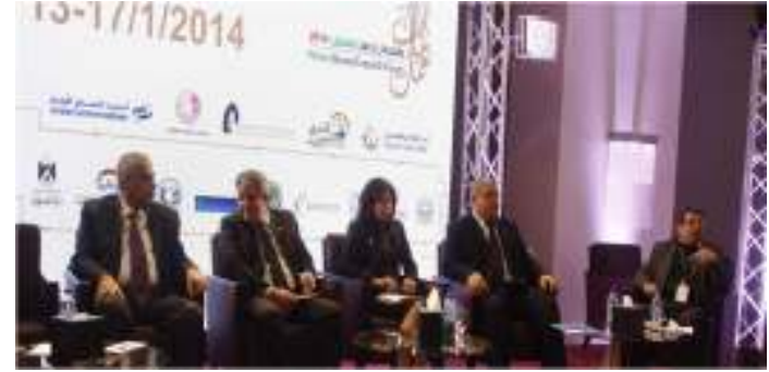
ملتقى مال وأعمال فلسطين