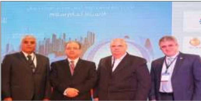
المؤتمر المصرفي العربي السنوي